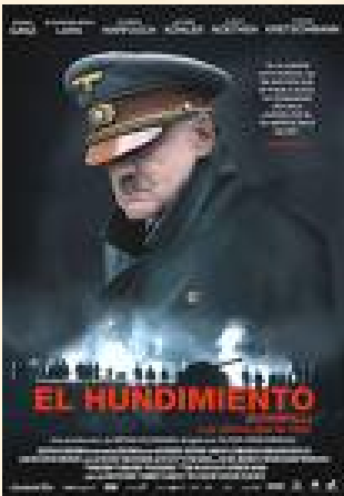
Cartelera de la película El hundimiento de Oliver Hirschbiegel (2004)

La Reacción de Apoptosis alarma , además, a los 'sistemas vecinos' a dicho container, que captan la presencia de un PROBLEMA, de un DOLOR, de un SÍNTOMA y, 'tentándose la ropa', empiezan a pensar y a rectificar, quizás esta vez rectifican acertadamente.